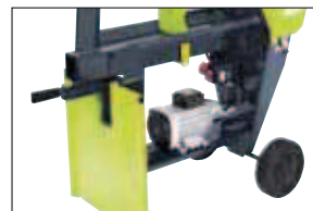
Odkládací stůl (F0001899)