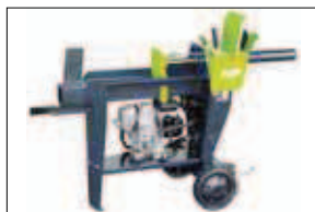
Horizontální štípačka 550 s benzinovým motorem