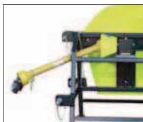
Stolní pila na kolech s kloubovým hřídelem