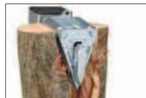
Speciální nůž s válečky pro metrové dřevo (F0001654)