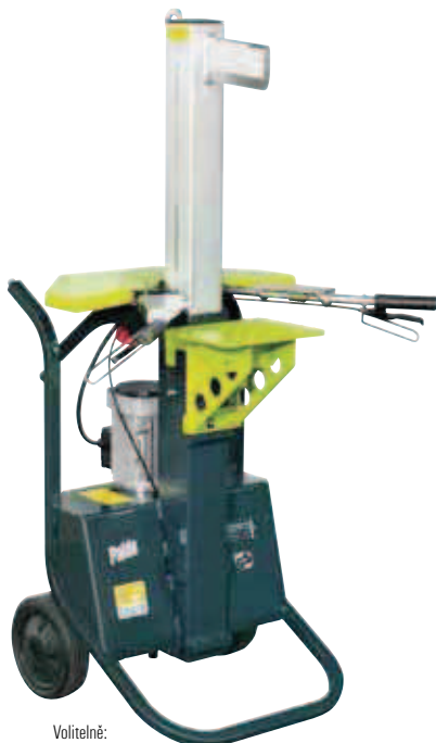
Volitelné: Odkládací stůl

Silná štípačka dřeva se štípací silou 6 t, nastavitelným štípacím zdvihem a nastavováním výšky štípacího stolu bez použití nářadí pro ergonomické štípání. Max. délka polena: 105 cm