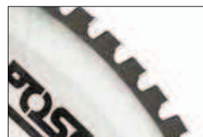
Vidiový pilový kotouč (Z1300103)