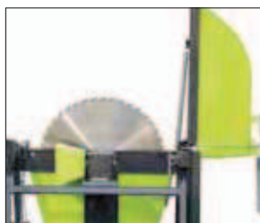
Otevřený stůl na kolech