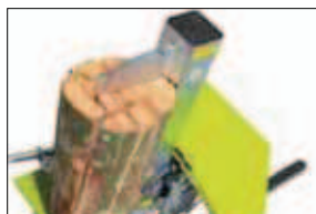
Snadno a rychle