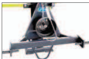
Sériové tříbodové zavěšení