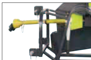
S kloubovým hřídelem