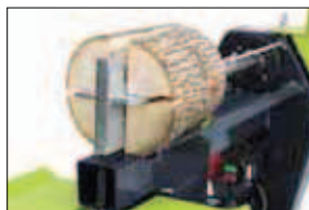
Štípací kříž (F0001893)