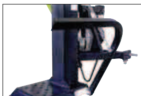
Volitelně: Zařízení pro zvedání kmene