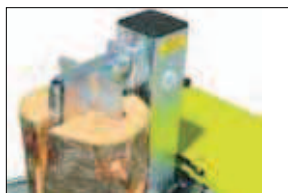
Štípací kříž (F0001831)