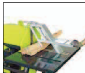
Stůl na kolech s kuličkově uloženým vedením