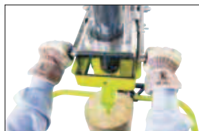
Sériově dvouúčetní bezpečnostní zapínání

Přepravní poloha se sklopeným válcem. Volitelné: elektropohon a zařízení pro zvedání kmene.